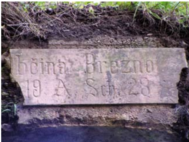
Kamnita plošča na mostu na Brezniškem potoku pri Snobejevem križu z napisom Občina Brezno in z letnico 1923, ko je bil most zgrajen

Dravograd–Maribor od cerkve proti kmetiji Rižnik, ki se je končala leta 1957. Velika pridobitev je bila elektrifikacija kraja. Začetek del je bil v letu 1954 in z veliko prostovoljnega dela krajanov je električna razsvetljava zamenjala petrolejke in karbidovke naslednje leto. Brezno je dobilo svoj prvi javni vodovod leta 1957, ko je bil zgrajen in predan namenu vodni bazen nad Pečečnikom v starem delu Brezna in zgrajeno vodovodno omrežje. V