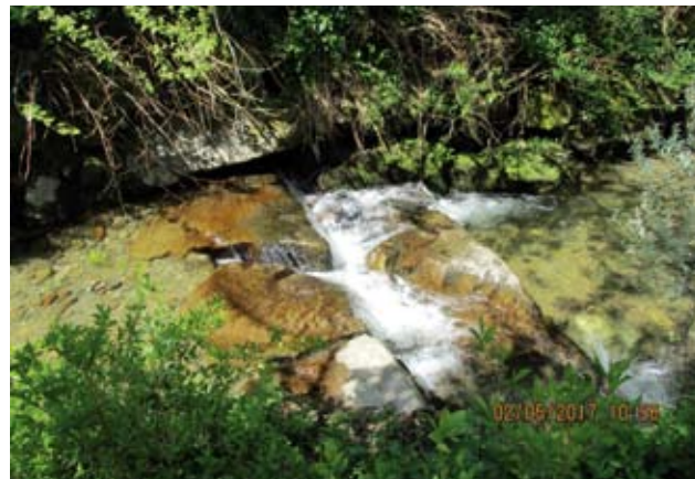
Presih v vsej svoji lepoti - umirjen in veličasten

Tudi dolino vasice Lehen je oblikoval potok – potok Presih. Izvira na nadmorski višini 900 m na območju zaselka Recenjok. Zanimivo je prav njegovo ime PRESIH. Značilno zanj je, da v vročih poletnih dneh presahne in v času deževja zopet napolni strugo.