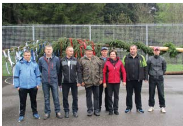
Postavitev majskega drevesa 27. aprila 2017 Udeleženci postavitve

Na dan boja proti okupatorju, 27. aprila 2017, smo skupaj s KUD Lehen izvedli postavitve majskega drevesa. Kljub dežju smo s kulturnim programom, ki sta ga pripravila KUD Lehen in UD Vila, obeležili dan boja proti okupatorju in 1. maj - praznik dela.