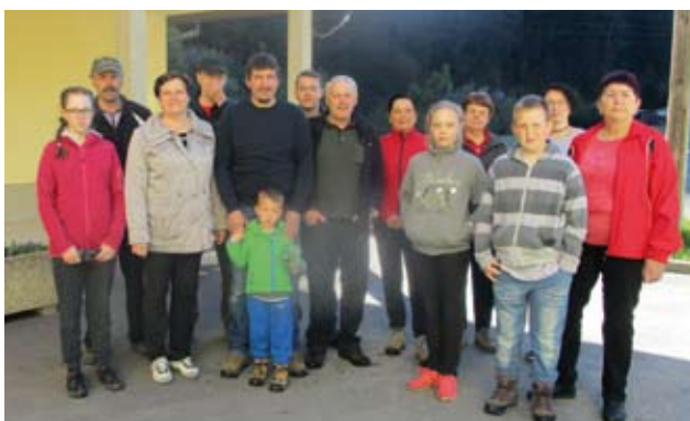
Čistilna akcija - april 2017

Vaška skupnost Lehen leži na severnem delu Pohorja in je najmanjša vaška skupnost med petimi v Občini Podvelka. Meji kar na dve sosednji občini, in sicer na Lovrenc na Pohorju in Ribnico na Pohorju. Ker skozi našo VS potekajo številne poti in ceste, ki povezujejo vaščane z ostalimi vasi in mesti, se še tem bolj trudimo, da je naše okolje čisto in prijazno. Zato že v prvih spomladanskih dneh izvedemo čistilno akcijo in pobereмо smeti in razne okolju neprijazne predmete, ki jih neosveščeni mimoidoči odvržejo kar v naravo. Tako smo tudi tokrat, drugo soboto v mesecu aprilu, izvedli čistilno akcijo. Akcije se je udeležilo kar nekaj vaščanov, ki jim čisto okolje nekaj pomeni.