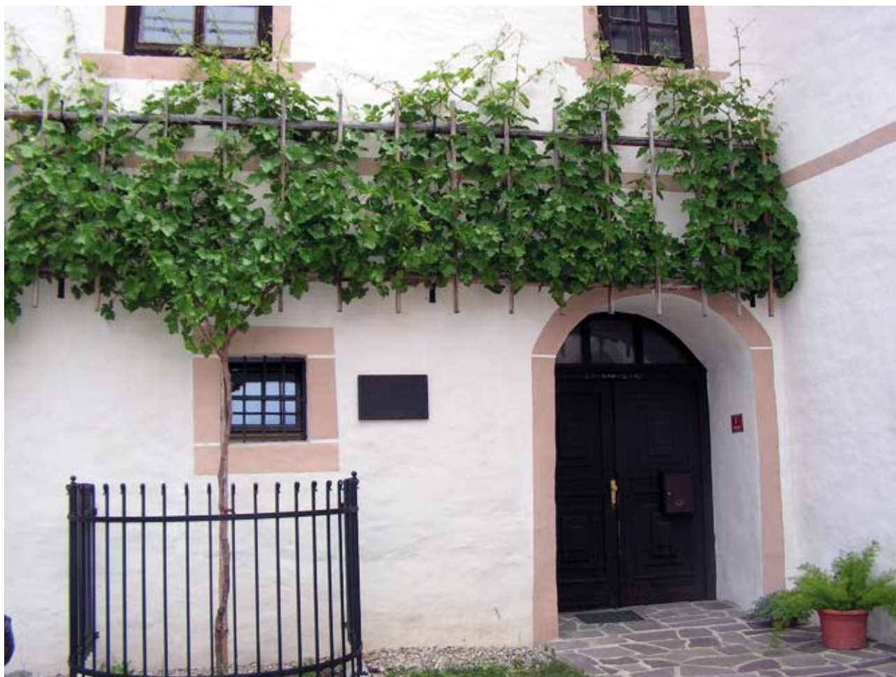
Potomka najstarejše trte na svetu, ki raste na župnijskem dvorišču v Breznu od leta 2010