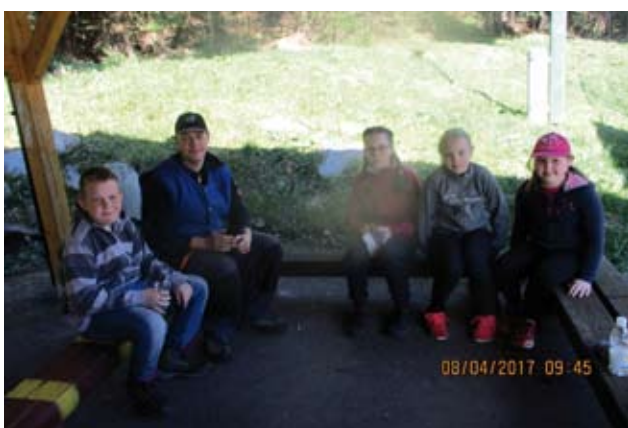
Mlajši udeleženci čistilne akcije 2017

V naši VS skrbimo za zdravje in dobro počutje vaščanov, zato smo v mesecu januarju 2017 skupaj s PGD Brezno Podvelka organizirali tečaj uporabe AED in TPO. Ekipa nujne medicinske pomoči Koroške in Koronarni klub Mežiške doline sta nam v večnamenskem prostoru PŠ Lehen prikazala, kako pomagati bolniku s srčnim zastojem z uporabo AED in TPO.