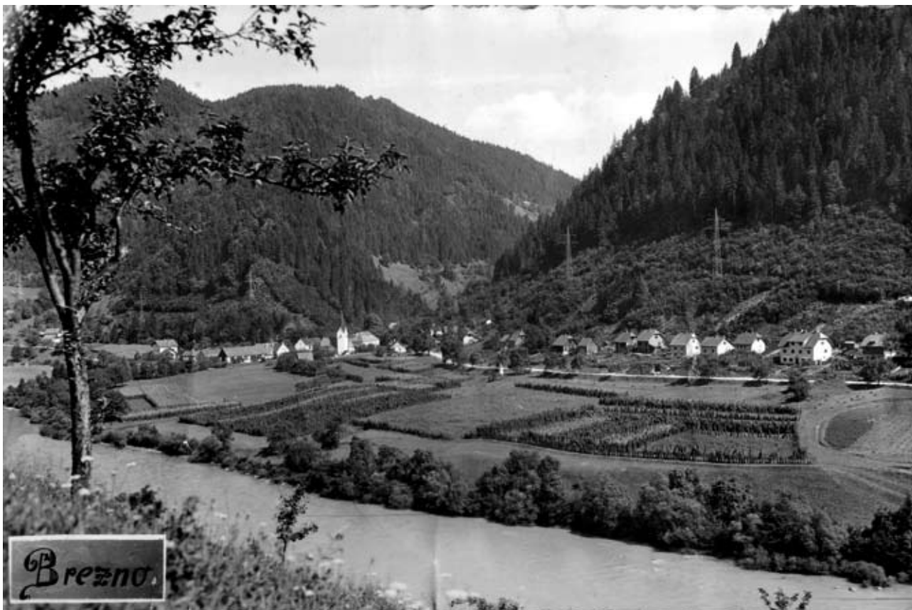
Brezno leta 1957

Za preteklost Brezna so značilne tudi številne gospodarske in obrtniške dejavnosti. Najstarejša je zanesljivo splavarjenje po reki Dravi. Prvi zgodovinski zapisi o splavarstvu na reki Dravi segajo v leto 1280. Največji razmah splavarjenja je bil v 19. in prvi polovici 20. stoletja. Samo iz splavarskega pristanišča v Breznu je leta 1938 odpeljalo 189 splavov, v splav so vgradili do 130 kubičnih metrov lesa. Istega leta je iz štirinajstih splavarskih pristanov