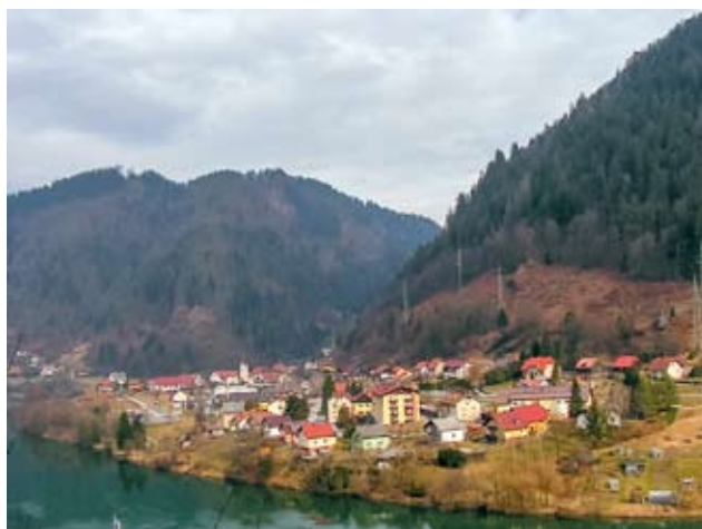
Brezno leta 2017

na reki Dravi od Libelič do Maribora izplulo 1.167 splavov z žaganim, stavbnim in okroglim lesom. Po številu odpeljanih splavov v tem letu se je Brezno uvrstilo na drugo mesto za Dravogradom s 474 splavi in pred Ožbaltom s 93 splavi. Statistični podatki kažejo, kako pomembna je bila v tem času za Brezno in njegovo okolico splavarska dejavnost, ki je dajala kruh številnim lastnikom gozdov, gozdarjem, tesarjem, žagarjem (samo na Brezniškem potoku je v tem času delovalo pet žag), prevoznikom in seveda splavarjem. Zadnji splav je po Dravi odpeljal leta 1950.