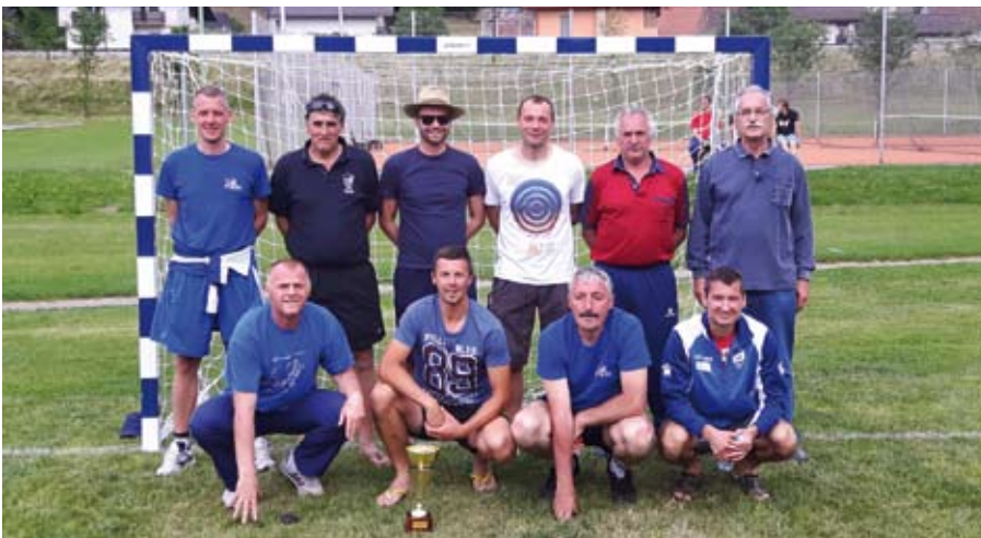
Veterani se ne dajo! 3. mesto v nogometu - pokalno tekmovanje za veterane v Vuzenici

Preteklo leto je bilo ponovno zelo aktivno in pestro na vseh nivojih delovanja ŠD Ožbalt ob Dravi. Naš osrednji projekt je bila izvedba osrednje veselice ob Občinskem prazniku Občine Podvelka. Projekt tridnevnega dogajanja smo skupaj s partnerji tudi uspešno izpeljali.