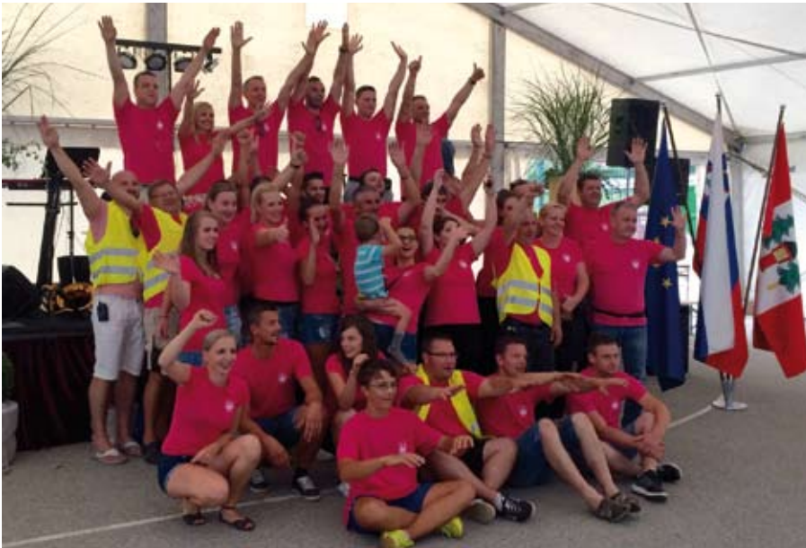
Skupaj zmoremo vse!