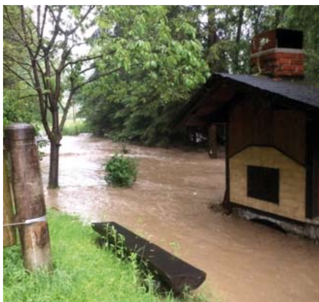
Le kdo je našega Presiha tako ujezil, da je razjarjen gmel po »Lehnški« dolini?

Ponovno je potok prerastel v hudournik 13. junija 1994, vendar takrat ni naredil takšne velike škode. Poplavlil je travnike in odplaknil nekaj vrtov.