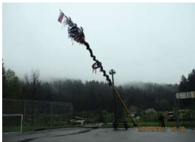
... in majske drevo se ponosno dviga