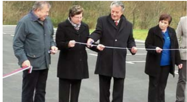
Otvoritev novega parkirnega prostora pri PŠ Lehen

Pomemben dogodek v naši VS je bil gotovo otvoritev novega parkirnega prostora pri Podružnični šoli Lehen in 20. obletnica delovanja Kulturno umetniškega društva Lehen. Prireditvev je potekala 20. novembra 2016. Z novim parkiriščem