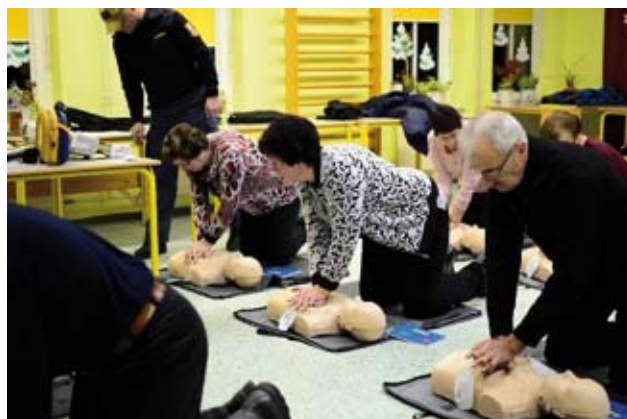
Tečaj uporabe AED in TPO

V naši VS skrbimo za zdravje in dobro počutje vaščanov, zato smo v mesecu januarju 2017 skupaj s PGD Brezno Podvelka organizirali tečaj uporabe AED in TPO. Ekipa nujne medicinske pomoči Koroške in Koronarni klub Mežiške doline sta nam v večnamenskem prostoru PŠ Lehen prikazala, kako pomagati bolniku s srčnim zastojem z uporabo AED in TPO.