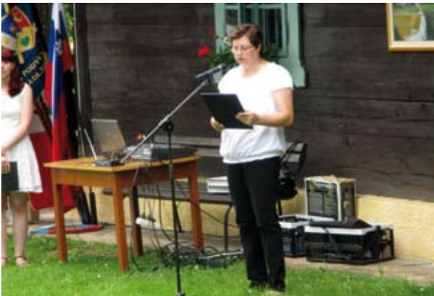
Slavnostna govornica – predsednica VS Lehen

Osrednja proslava in 22. jubilejni pohod, ki ga ob Dnevu državnosti – 25. juniju, prirejajo častniki občin Muta, Podvelka, Ribnica na Pohorju, Radlje ob Dravi in Vuzenica ter Območno združenje veteranov vojne za Slovenijo Zgornje Dravske doline, sta potekala tokrat v naši vaški skupnosti. Pohod je bil rekreativnega značaja. Start pohoda je bil pri lovski koči Klančnik, nato je pot vodila do kmetije Planinšič in naprej do cerkve sv. Ignacija, kjer je pohodnike čakalo okrepčilo. Sledil je povratek do lovske kočice pri Klančniku, kjer je potekala proslava v počastitev dneva državnosti Republike Slovenije.