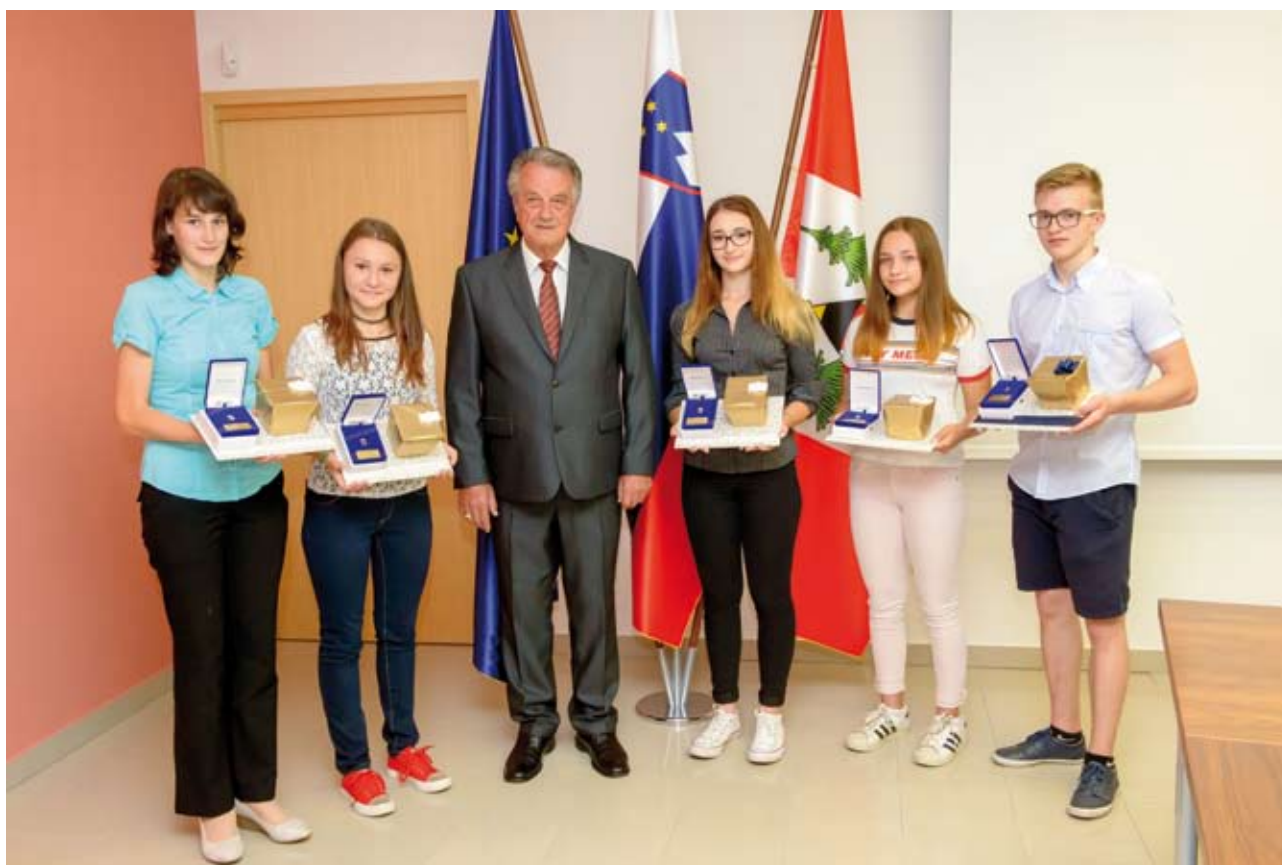
Dobitniki zlatih petk z županom Občine Podvelka