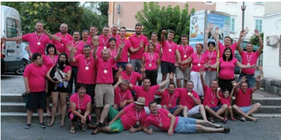
12. s kolesi na morje (Ožbalt–Koper; 270 km)